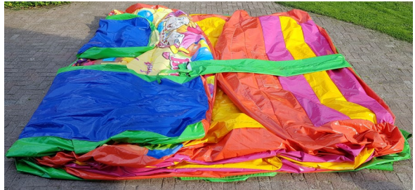
Glijbaan, slurf en opstapje naar binnen