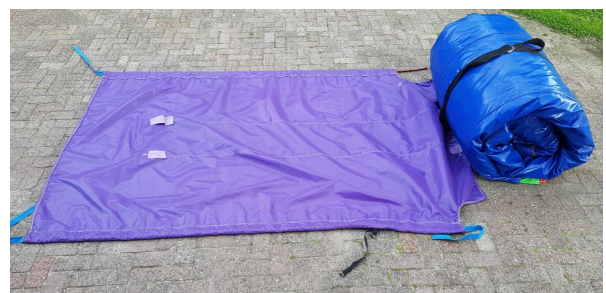
Oprollen, beginnen bij dikste gedeelte, band er om en daarna de hoes.

NB Bij regen springkussen opgeblazen laten of binnen leggen.