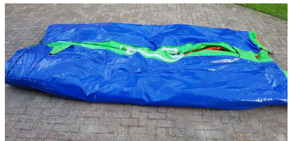
Andere gedeelte ook tot midden